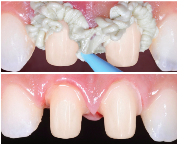
Ob allein oder mit der 2-Faden-Technik verwendet, Access Edge und AccessFLO überzeugt bei der Gingivaretraktion und Hämostase.